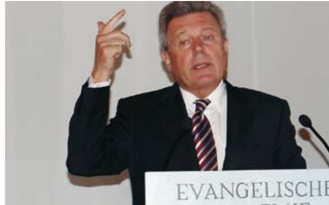
Rainer Stinner (FDP), MdB, außenpolitischer Sprecher der FDP-Fraktion im Deutschen Bundestag

Die 2-Staaten-Lösung schadet Israel nicht und sie bedroht es auch nicht. Deutschland muss die 2-Staaten-Lösung fordern und das in der Europäischen Union durchzusetzen helfen.