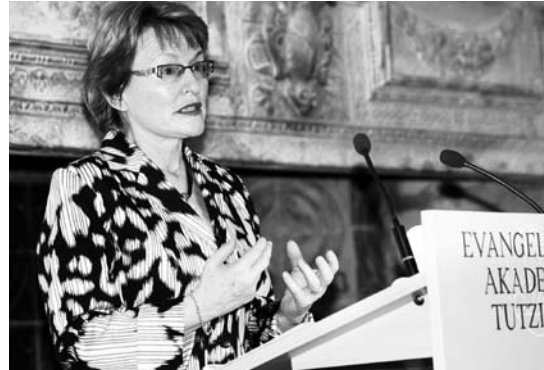
In ihrem Vortrag berichtete Premierministerin Helen Zille über ihr politisches Bestreben, ihr Land weiterhin zu demokratisieren.

Die südafrikanische Provinz Westkap - sie ist die einzige von neun Provinzen, die der Afrikanische Nationalkongress (ANC) nicht regiert - hat ein großes Interesse daran, dass sich die Evangelische Akademie Tutzing und andere Nichtregierungsorganisationen an der weiteren Entwicklung der Gesellschaft und Demokratie in Südafrika beteiligen. Südafrika befindet sich auf dem Weg zur Zivilgesellschaft, hat aber die Schatten der Apartheid noch nicht völlig überwunden. Wohin der Weg zukünftig führen soll, darüber hat Premierministerin Helen Zille in ihrem Vortrag gesprochen.