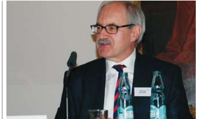
Günther Gloser (SPD), MdB, Staatsminister a.D. beim Bundesminister des Auswärtigen

Wir haben in der Vergangenheit vieles geschafft. Die Aussöhnung mit den Erbfeinden und die Überwindung der Kriege in Europa. Allerdings bei allem Erfolg in diesen Dingen: Ich will keine Vereinigten Staaten von Europa, sondern es gilt, die Zukunft gemeinsam mit unseren Nachbarn zu gestalten. Wir müssen unsere Finanz- und Wirtschaftspolitik stärker aufeinander abstimmen. Insofern brauchen wir mehr Europa, aber nicht in allen Bereichen.