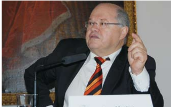
Jerzy Montag (Bündnis 90/Die Grünen), Sprecher der bayerischen Grünen im Bundestag

Das Verhältnis Deutschlands zu Israel ist maßgeblich geprägt durch unsere Verantwortung für die Existenz Israels. Das bedeutet jedoch nicht, dass Deutschland zum Erfüllungsgehilfen jeder israelischen Politik werden muss.