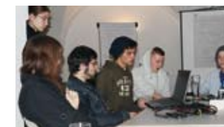
In allen Workshops wurde intensiv und engagiert gearbeitet.