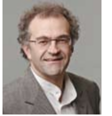
Prof. Dr. Kümmerer:

Die Gewinnung von elektrischer Energie aus Sonne und Wind scheint demgegenüber eine Alternative ohne Probleme zu sein, wenn man von Standortdiskussionen („Verspargelung der Landschaft“) absieht. Aber auch hier zeigt ein genauerer Blick, dass die Schwierigkeit im Detail liegt. Möglichst effiziente und große Windräder kommen ohne ein mechanisches Getriebe aus. Gleichzeitig benötigen sie aber möglichst starke Permanentmagnete. Diese werden aus Eisen hergestellt, dem in geringen Mengen hochmagnetisches Neodym beigegeben wird. Neodym ist ein Element, das zu den sogenannten seltenen Erden zählt. Auch in Photovoltaikzellen sind zum Teil ähnliche Elemente enthalten, um die Effizienz zu steigern. Die seltenen Erden aber auch andere strategisch wichtige Elemente finden nicht nur in Windrädern und Photovoltaik Verwendung. Sie werden auch elektronischen Bauelementen, die u.a. auch zur Steuerung dieser Anlagen dienen, sowie in Geräten zur Kommunikation, in Computern, in LEDs zur Beleuchtung, in elektrisch betriebenen Autos, effizienten Steue-