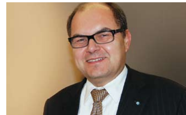
Christian Schmidt (CSU), Parlamentarischer Staatssekretär beim Bundesminister der Verteidigung