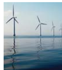
Der bei uns mit Windrädern und Photovoltaik produzierte saubere Strom wirft Probleme auf.

Für die Herstellung von Solarzellen und von Magneten für Windräder braucht man die seltenen Erden. Und deren weltweite Knappheit führt jetzt schon zu ökonomischen Verwerfungen.