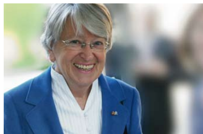
Hildegund Holzheid, die ehemalige Präsidentin des Bayerischen Verfassungsgerichtshofs und des Oberlandesgerichts München, ist Mitglied des Deutschen Ethikrates und hat sich in dieser Funktion für eine Zulassung der PID – allerdings unter eng begrenzten Voraussetzungen – ausgesprochen.

Etwa gleichzeitig im Jahr 2001 richtete der deutsche Bundeskanzler den Nationalen Ethikrat und der Bayerische Ministerpräsident die Bayerische Bioethikkommission ein. Ethische Fragen neuer Entwicklungen auf dem Gebiet der Lebenswissenschaften, insbesondere der modernen Medizin, standen im Zentrum der Aufgaben. Das gleiche gilt für den im Jahr 2008 auf gesetzlicher Grundlage errichteten Deutschen Ethikrat, den Nachfolger des Nationalen Ethikrats.