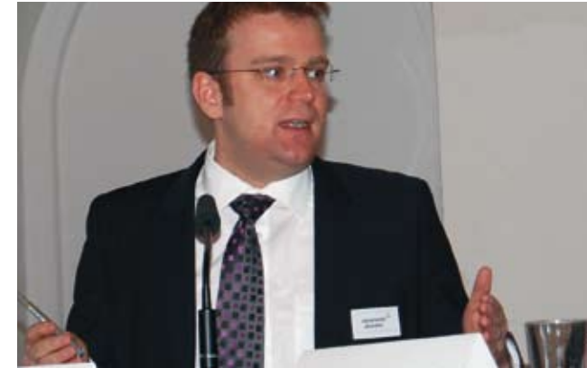
Reinhard Brandl (CSU), MdB, Mitglied des Verteidigungsausschusses im Deutschen Bundestag

Meine Auffassung ist, dass sich die gegenwärtigen Probleme eher in Pakistan entwickeln werden als in Afghanistan. Was unterscheidet Afghanistan und Pakistan? Es unterscheidet eines. Das eine Land hat viele Probleme und das andere auch, aber es hat auch eine atomare Bewaffnung. Und das stellt uns vor ganz andere Fragestellungen. Die Herausforderungen werden also nicht weniger. Es gibt kein Ende der Geschichte, sondern wir haben andere Fragestellungen mit neuen Problemen. Dazu braucht man keine Bundeswehr mit 500.000 Mann und vielen Divisionen. Man braucht aber eine kluge und in der Gesellschaft verankerte Bundeswehr, weil die Grenzen sehr viel fließender geworden sind, was die Abgrenzung des Militärischen und des Nichtmilitärischen betrifft.